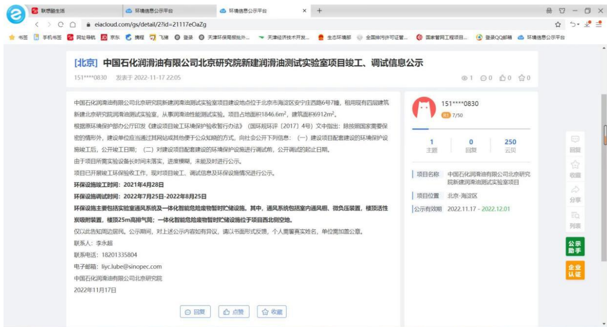
图 1 本项目竣工、调试信息公示图